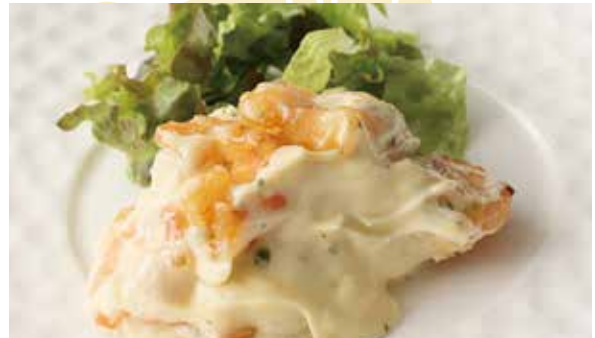
おすすめ 小海老のマヨネーズソース 1,200円