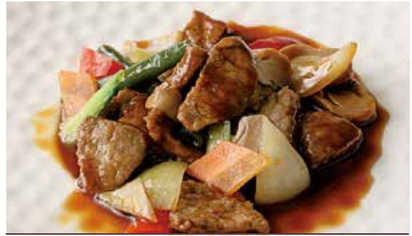
おすすめ 牛肉のオイスターソース炒め 1,200円