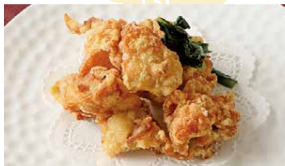
おすすめ 鶏の唐揚げ 600円