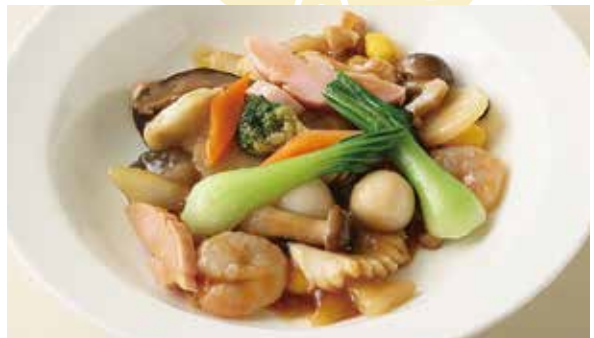
おすすめ 八宝菜 1,400円