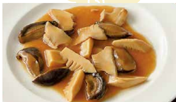
おすすめ あわびの醤油煮込み (3名盛り) 6,000円