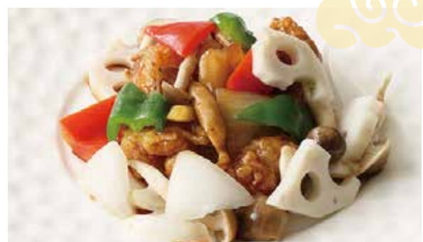
おすすめ ホタテ貝柱の黒胡椒炒め 1,200円