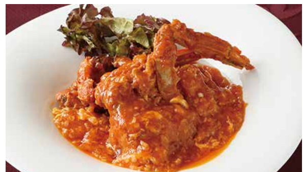
おすすめ 渡り蟹のチリソース 1,350円