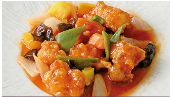
おすすめ パイナップル入り酢豚 1,200円