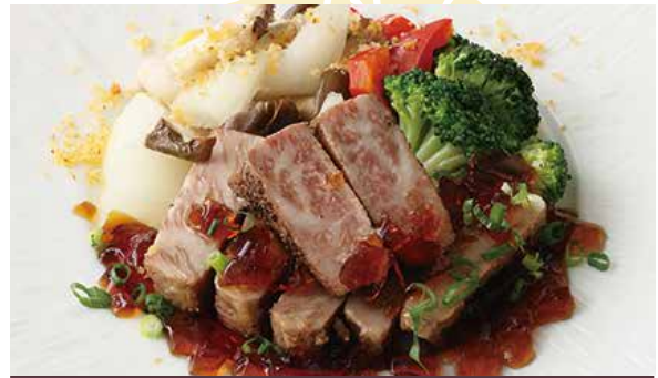
おすすめ みかわ牛ロース肉の煎り焼き 山椒ソース 4,000円