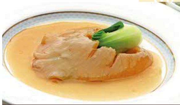
おすすめ 大フカヒレの姿煮込み 15,000円

※原材料の高騰により、料金改定をしております。 ※写真はイメージです。 ※料金は消費税が含まれています。