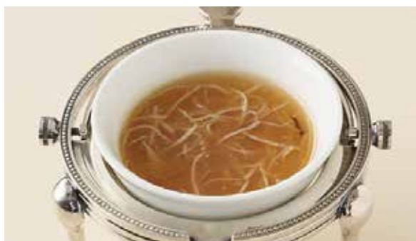
おすすめ フカヒレスープ 1,100円