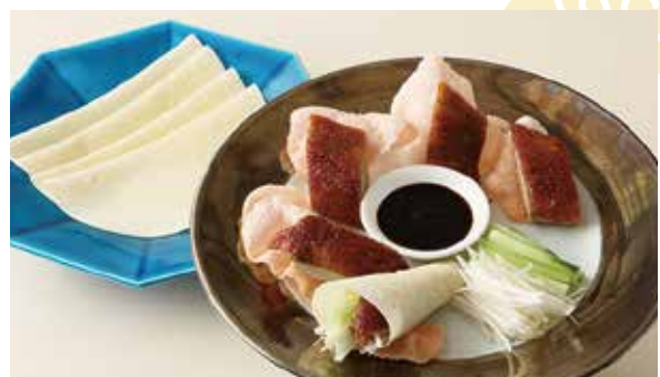
おすすめ 北京ダック 5,500円