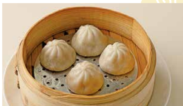
おすすめ 小籠包 600円