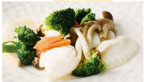
おすすめ イカと野菜炒め 1,000円