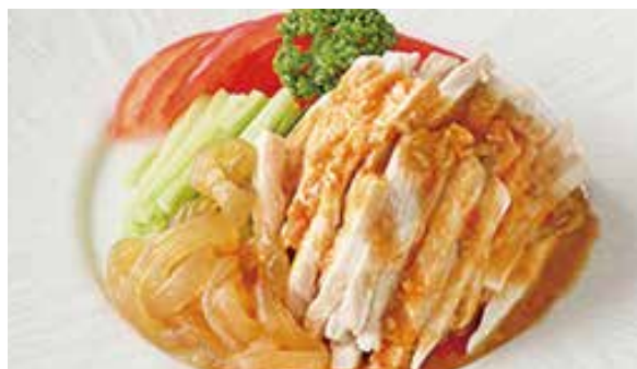
おすすめ 棒棒鶏 (バンバンジー) 900円