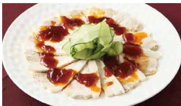
おすすめ 豚肉の蒸し物 ニンニクソース 900円