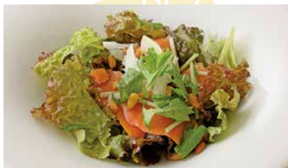
おすすめ 松の実入りサーモンサラダ 900円