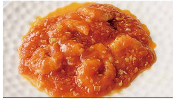
おすすめ 小海老のチリソース 1,200円