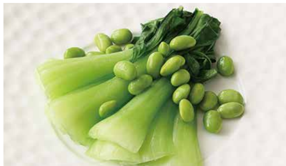
おすすめ 中国野菜の強火炒め 900円